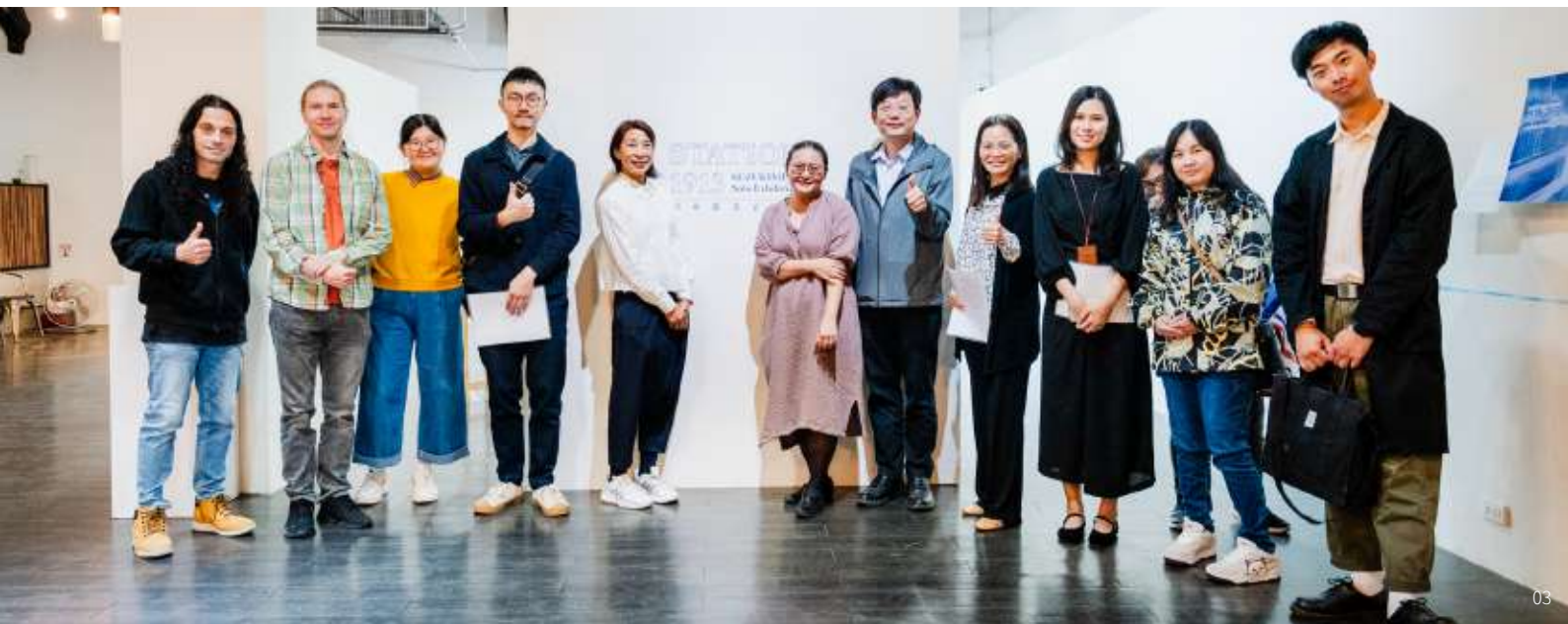
01 英國籍駐村藝術家帶著他的作品，探索新竹市的河岸人為風景