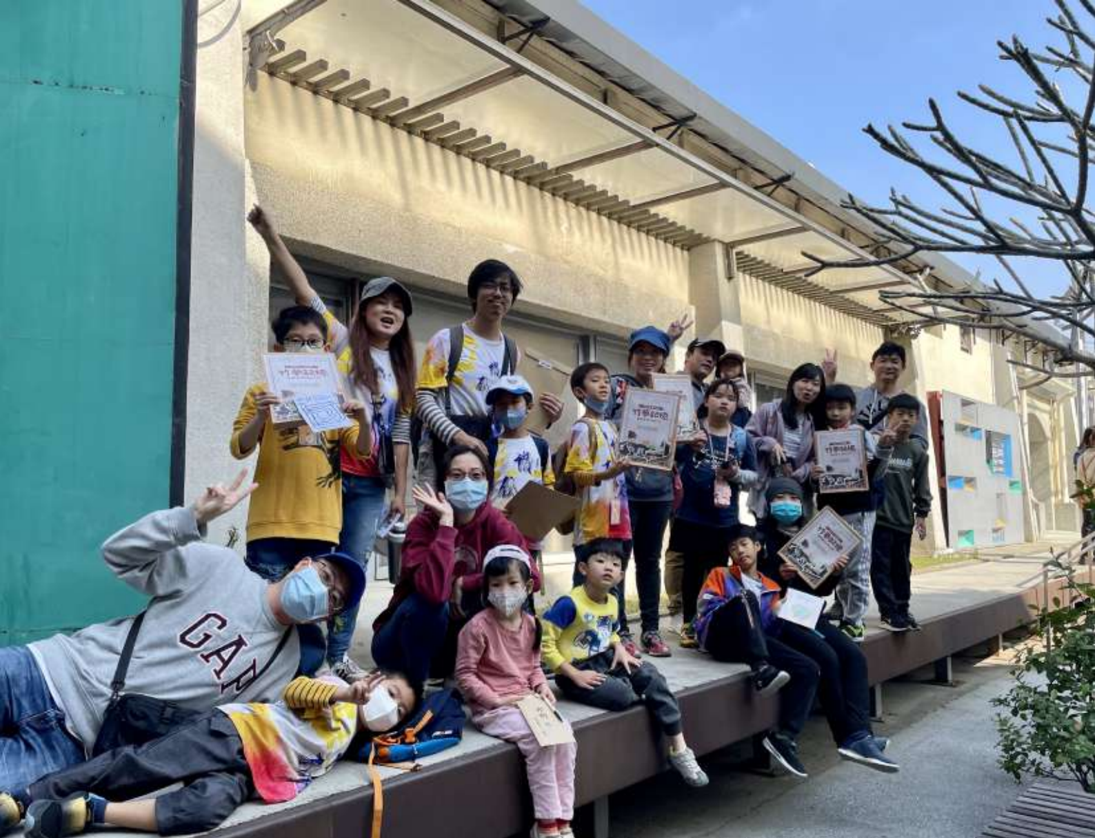
館館合作參與民眾於藝術村前留影

動；「辛志平校長故居」結合藝術、音樂、文學、食物等主題的教育和生活體驗，不定期舉辦快閃店及藝文活動；「下竹町（南大路警察宿舍）」不定期有假日文創市集及走讀與實境遊戲等，透過館舍間網路社群互相宣傳、分享及串連，讓新竹市民更能了解在地的藝文館舍。